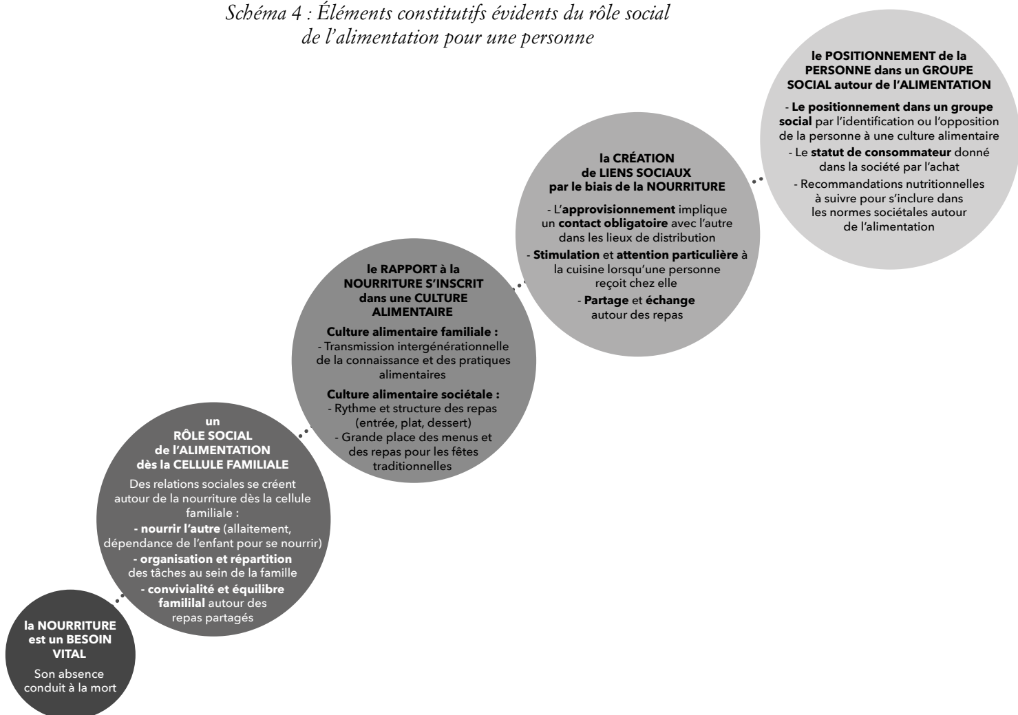
Schéma 4 : Éléments constitutifs évidents du rôle social de l'alimentation pour une personne

Enfin, la nourriture permet également à une personne de se positionner dans la société . L'individu va pouvoir se positionner dans un groupe social par son identification ou son opposition à une culture alimentaire. De plus, l'achat donne indéniablement une place dans notre société en tant que consommateur. Et suivre les nombreuses recommandations nutritionnelles permet aux personnes de s'inclure dans les normes sociétales autour de l'alimentation.