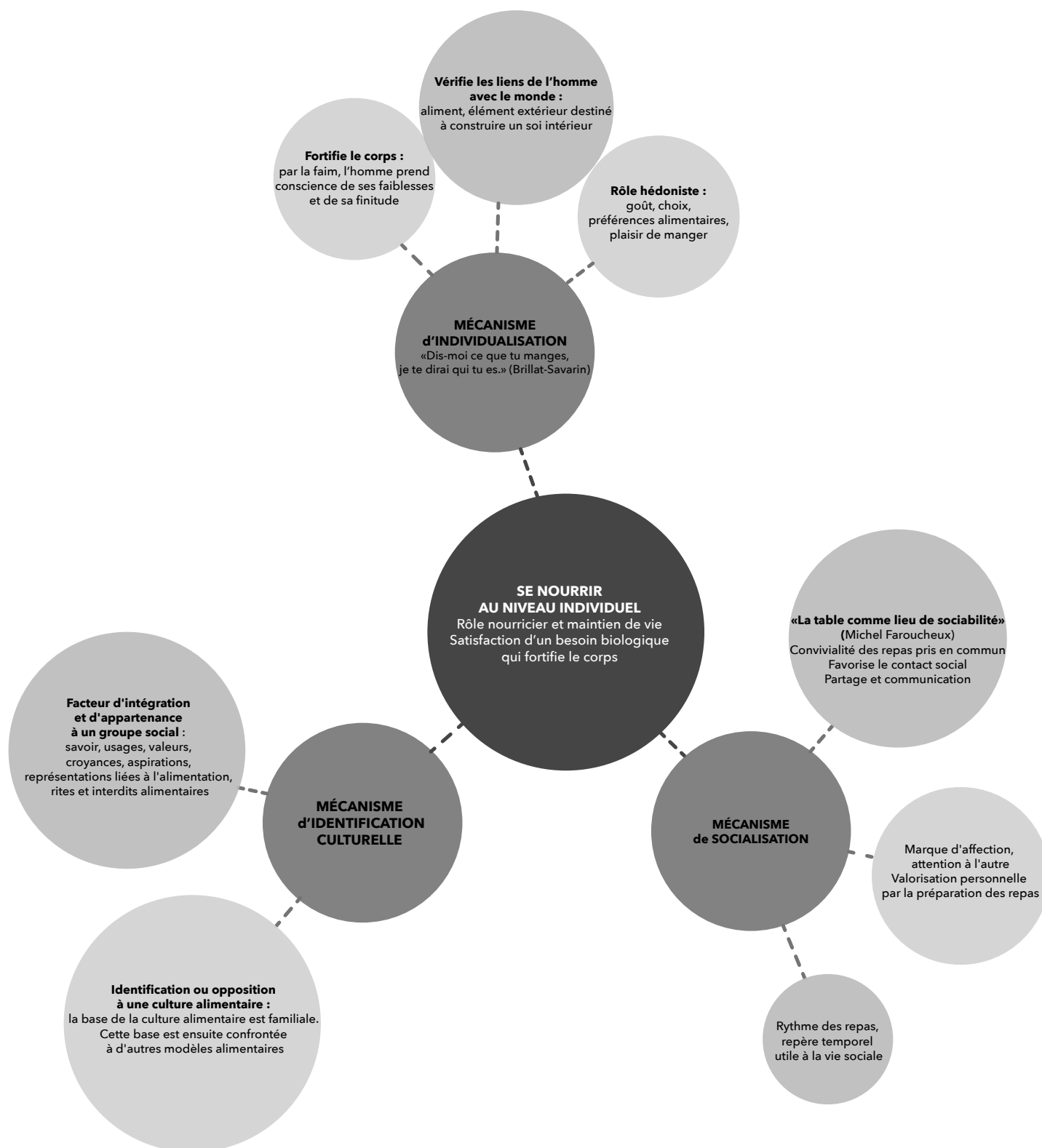
Schéma 2 : Incidences de la nourriture sur la construction de la personne